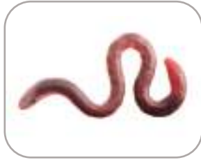
un ver de terre